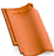
Bornholm czerwona natura

1D DACHÓWKA STANDARDOWA min. wartość obliczeniowa szt./m 2 : .....12,2 szt./m 2 : .....ok. 12,5 szt./paleta: .....240 waga 1 szt.: .....ok. 3,8 kg